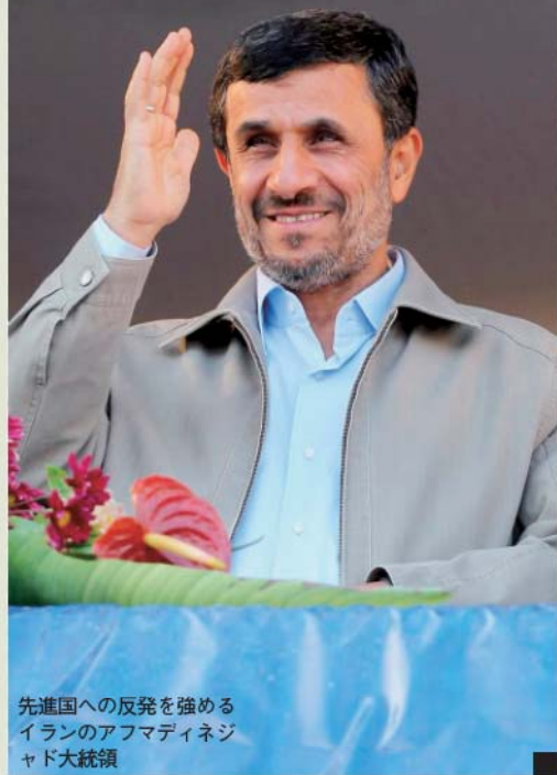
先進国への反発を強める イランのアフマディネジャド大統領